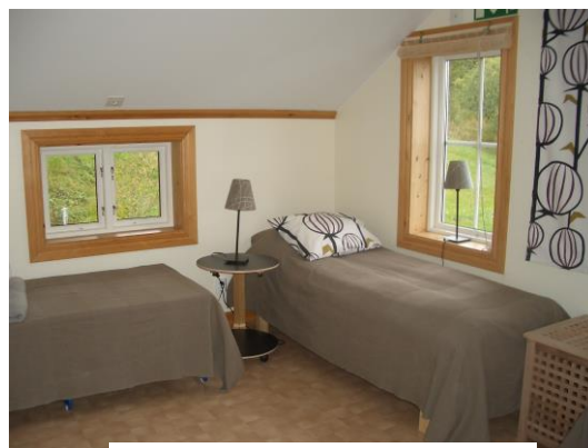
Ett av de nya rummen

I och med utbyggnaden på 1990-talet har vi nu utrymmen som kan hyras ut för enskilda och mindre grupper då lokalerna inte är upptagna av ungdomsarbetet. På övervåningen finns ett "allrum" med soffhörna och minikök samt två fräscha mindre rum med sängar. Sammanlagt kan vi erbjuda 11 sovplatser. På bottenvåningen kan missionshusets kök disponeras vid behov. Där finns också två rymliga toaletter, varav en med dusch.