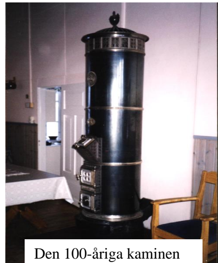
Den 100-åriga kaminen

1950 beslöt man att genomföra omfattande reparationsarbeten. Kostnaderna uppgick till i runt tal 25 000 kronor.. I gåvor och anslag fick föreningen in 22 000 kronor. Därtill kom tidigare reserverade medel.