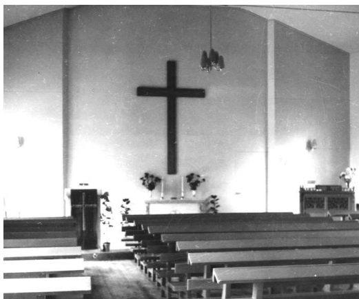
Missionshuset efter renoveringen 1951

har man spikat plattor.. Den elektriska installationen är helt ombyggd och vidare är det nymålat både i möteslokalerna och vaktmästarbostaden.