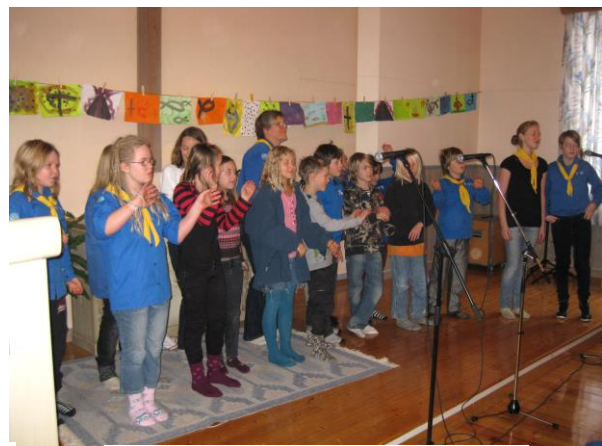
Scoutgudstjänst hösten 2008